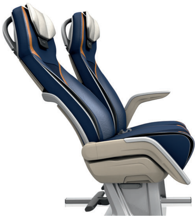
Ambiance cossue mise en valeur par le pli du cuir contrasté.