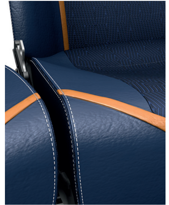
Partie avant de l'assise en cuir, double surpiqûre au lieu du liseré