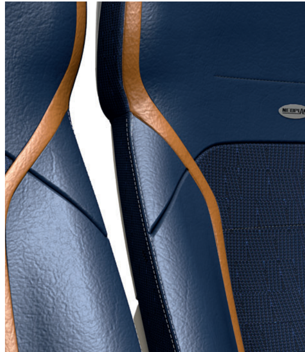
Triangel-Element in Leder