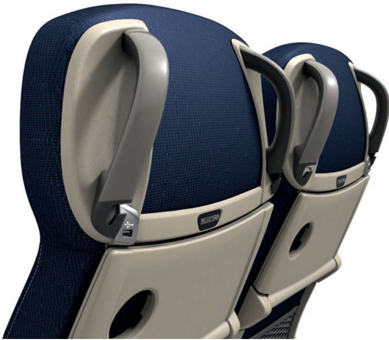
Haltegriffe in Perlmausgrau